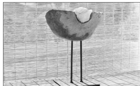
Limestone van de Curaçaose Tafelberg.