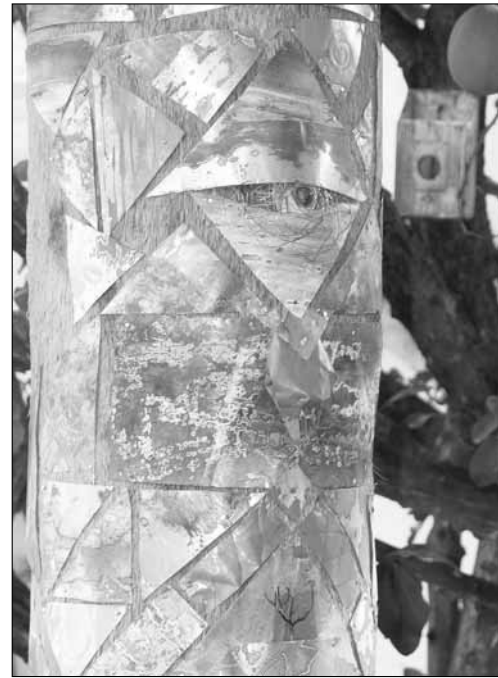
Overgangskalender van Vissen- naar Watermantijdperk.