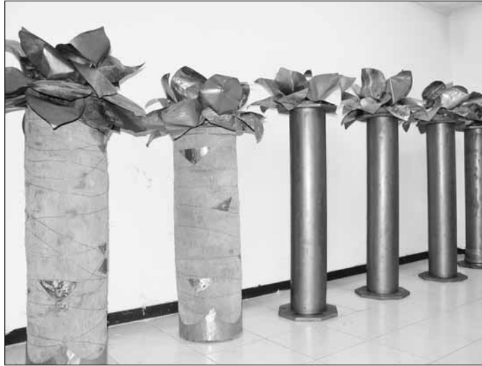
In de ban van de lotus.